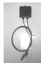
Socket outlet untuk pemasangan serie